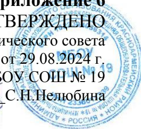
Таблица-сетка часов учебного плана МБОУ СОШ № 19 ст. Марьянской Красноармейского района для 11 класс группа социально-экономического профиля, социально-экономической направленности реализующих ФГОС СОО-2022 на 2024 – 2025 учебный год.